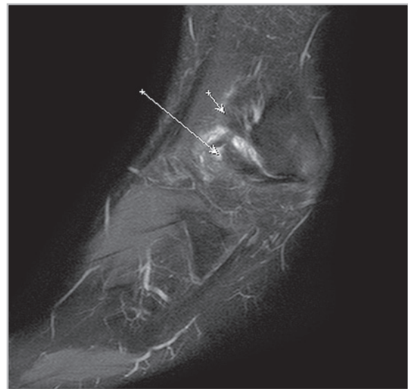
Рис. 3. МР-томограмма голеностопного сустава. PD FS ВИ. Сагиттальная плоскость. Застарелое повреждение передней таранно-малоберцовой (1) и дополнительного пучка передней нижней межберцовой (2) связок

В группе обследованных по традиционной методике переднелатеральный