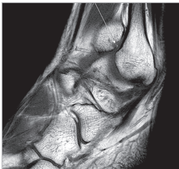
Рис. 4. МР-томограмма голеностопного сустава. T1 ВИ. Сагиттальная плоскость. Свободное костное тело в переднелатеральном пространстве (стрелка)

импинджмент-синдром встретился у 9,4 % больных, тогда как в группе обследованных по специально разработанной методике — у 21,9 %. Применение трехмерных последовательностей (T2* GRE) дает возможность определить все признаки переднелатерального импинджмент-синдрома. Эти последовательности позволяют выявить также хондральные и субхондральные дефекты суставного хряща большеберцовой кости и блока таранной кости на всем протяжении.